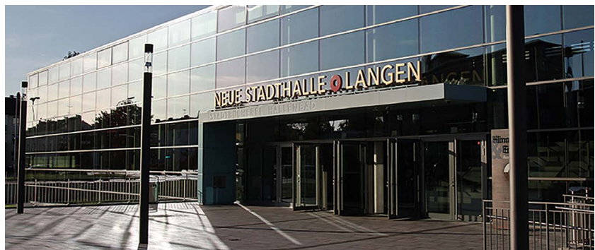
Foto der Neuen Stadthalle Langen