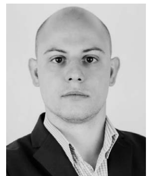
Robin Hackh Rudolfs Küche und Café www.rudolfs.de